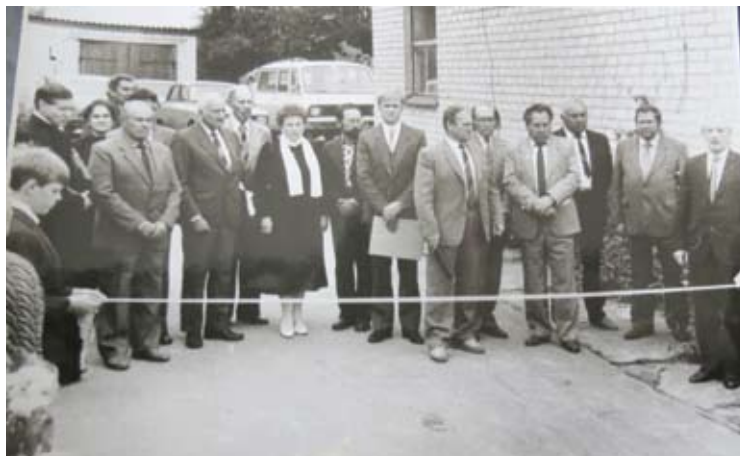
Konstantino Sirvydo vardo suteikimas Dabužių mokyklai.

Pasiteiravus, kaip gyvenanti šiandien, pašnekovė tvirtino, kad visko pakanka, nes „nebe tokie poreikiai, nebereikia nieko išlaikyti“. Moteris džiaugėsi, kad Dabužiuose įvesta vandentiekio sistema, kad pagaliau turinti namie visus patogumus. „Tiesa, yra šiokių tokių nesklandumų, nes vandentiekį įvedė, o kas dėl nuotekų sistemų, tai pinigų tam reikalui nebepakako. Bet randam mes, gyventojai, išeitį, nesiskundžiam. Gyvenimas sava vaga eina“, – kalbėjo senjorė.