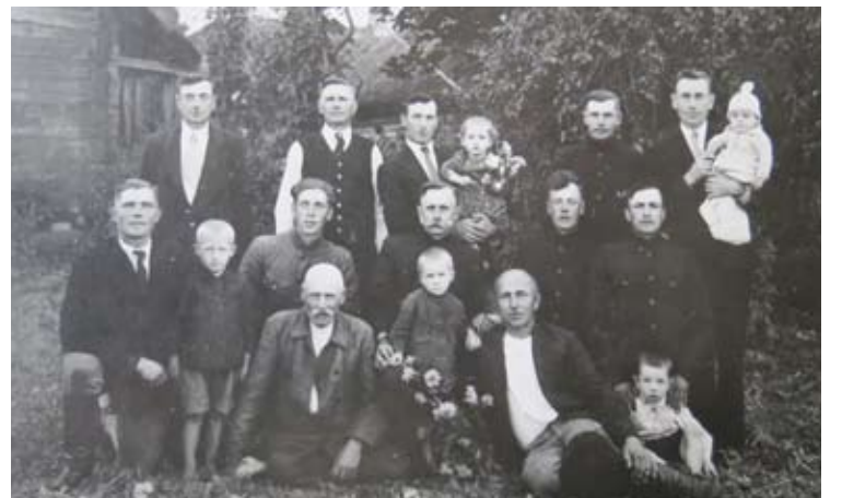
Sirvydų kaimo vyrai 1937 metais.