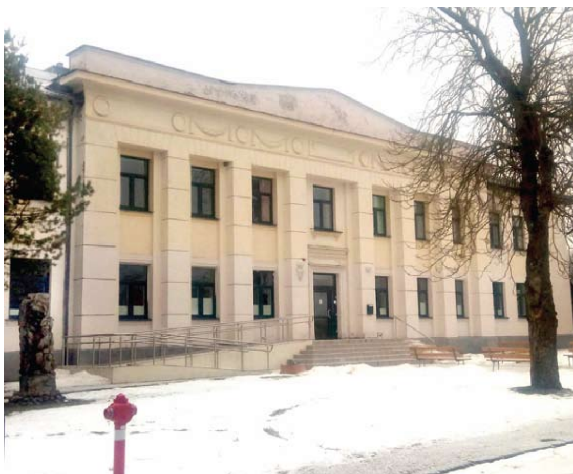
Troškūnų palaikomojo gydymo ir slaugos ligoninės pastatas liks rezerviniu. Jis gali būti panaudotas sergančiųjų koronavirusu gydymui.

Iki šios savaitės pabaigos visi anykštėnai, besigydantys palaikomojo gydymo ir slaugos skyriuje, turėtų būti suvežti į Anykščių ligoninę. Iki šiol senyvi žmonės gydėsi ir Anykščiuose, ir Troškūnuose.