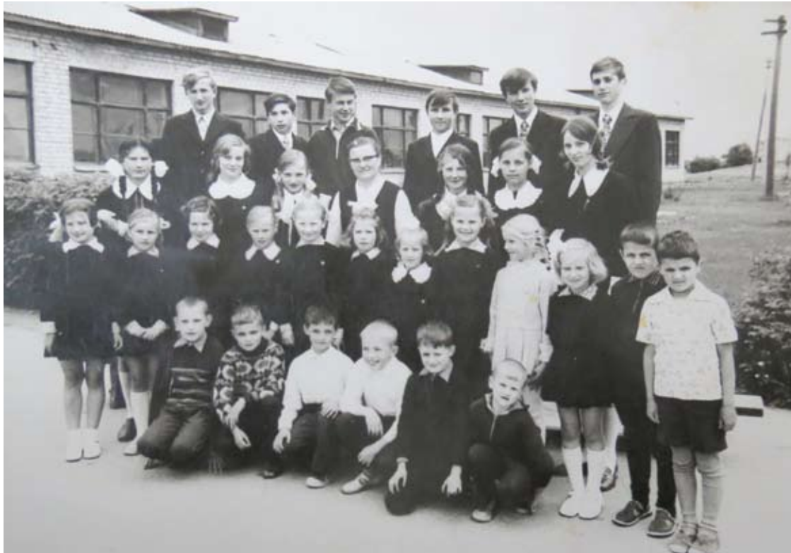
Pedagoginio darbo metus prisiminus...