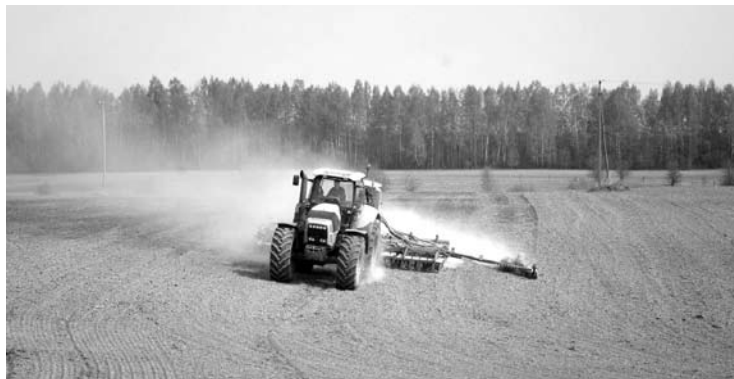
Kol kas pasėlius deklaruoti galima tik nuotoliniu būdu.