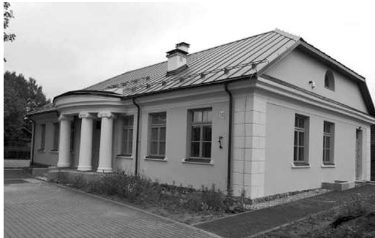
Pakartotinas konkursas patalpų nuomai Okuličiūtės dvarelyje bus skelbiamas pasibaigus karantinui.

dvarelyje įrengtą Istorijų dvarelį planuota atidaryti balandžio pradžioje, tačiau dėl pasaulyje ir